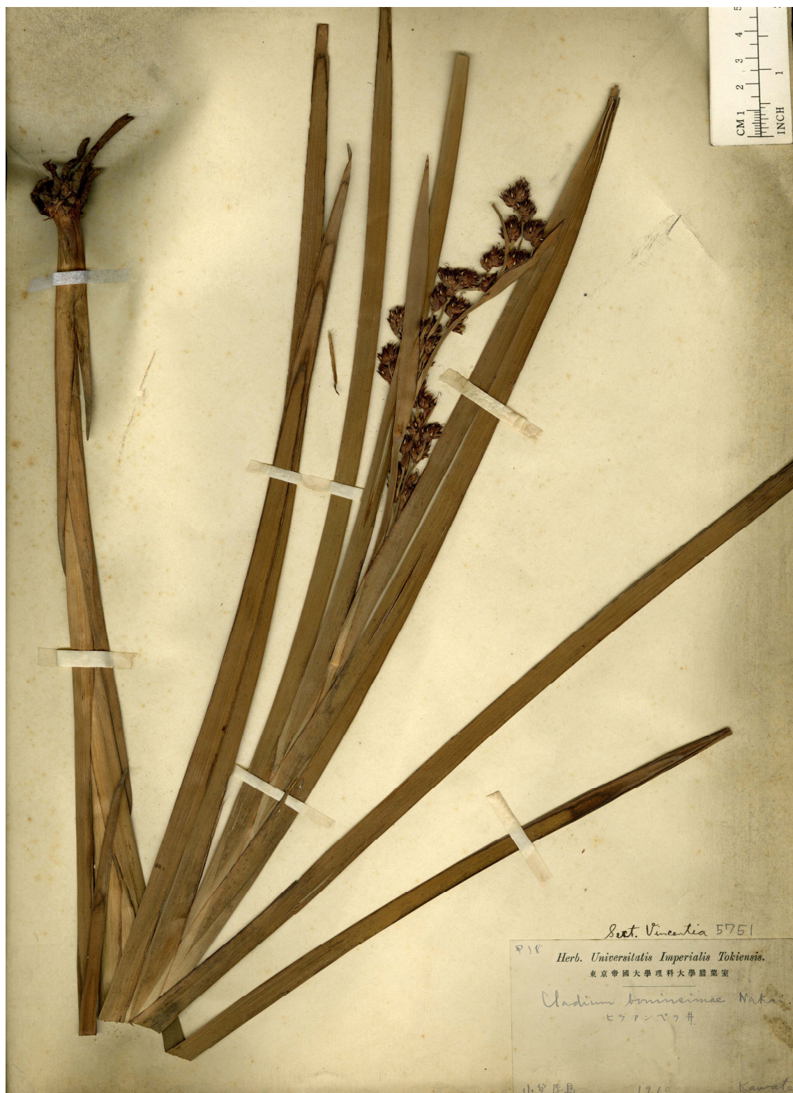
Fig. 9. Syntype of Cladium boninsimae Nakai (= Machaerina glomerata (Gaudich.) T. Koyama) (K. Kawate no. 甲18 in 1910, TI).