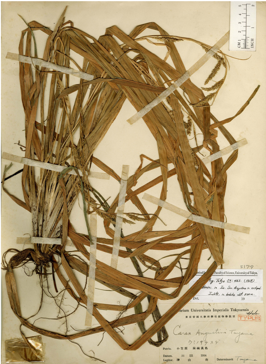
Fig. 1. Holotype of Carex augustini Tuyama (T. Tuyama s.n., 14 Apr. 1936, TI).