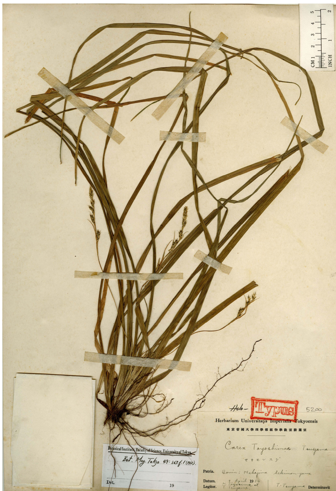
Fig. 5. Holotype of Carex toyoshimae Tuyama (J. Toyoshima & T. Tuyama s.n., 9 Apr. 1934, TI).