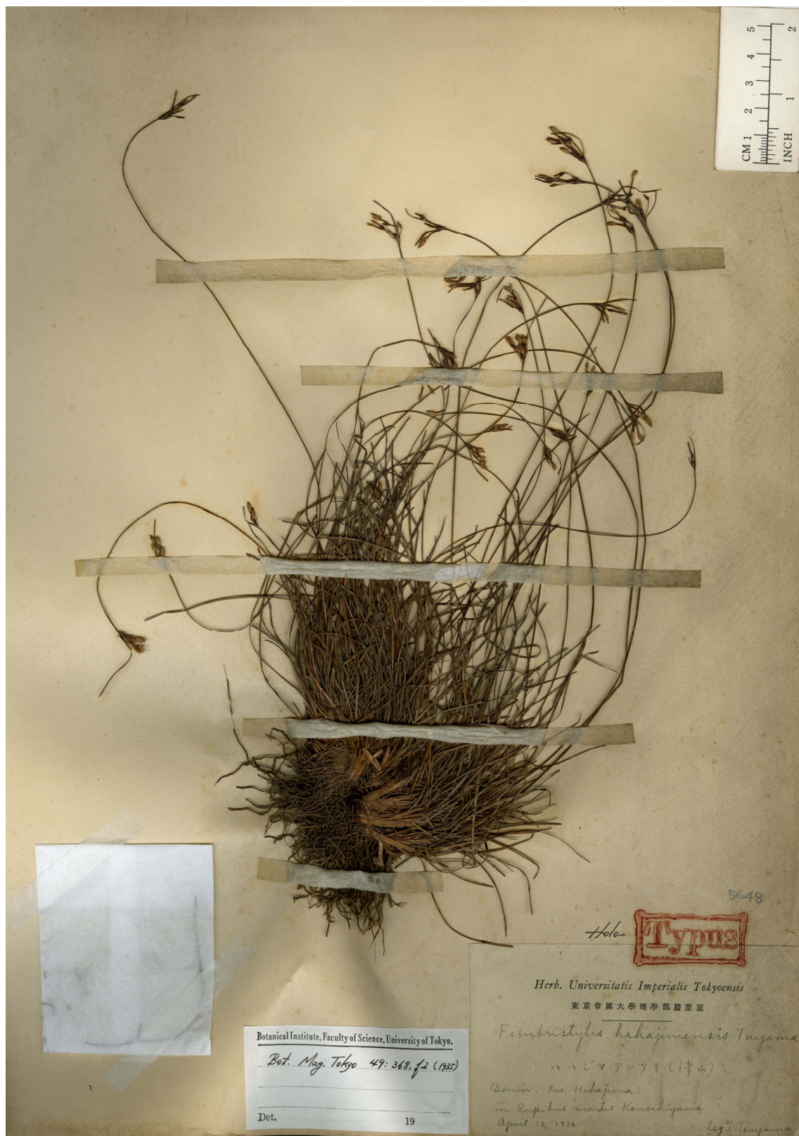
Fig. 7. Holotype of Fimbristylis hahajimensis Tuyama (T. Tuyama s.n., 13 Apr. 1934, TI).