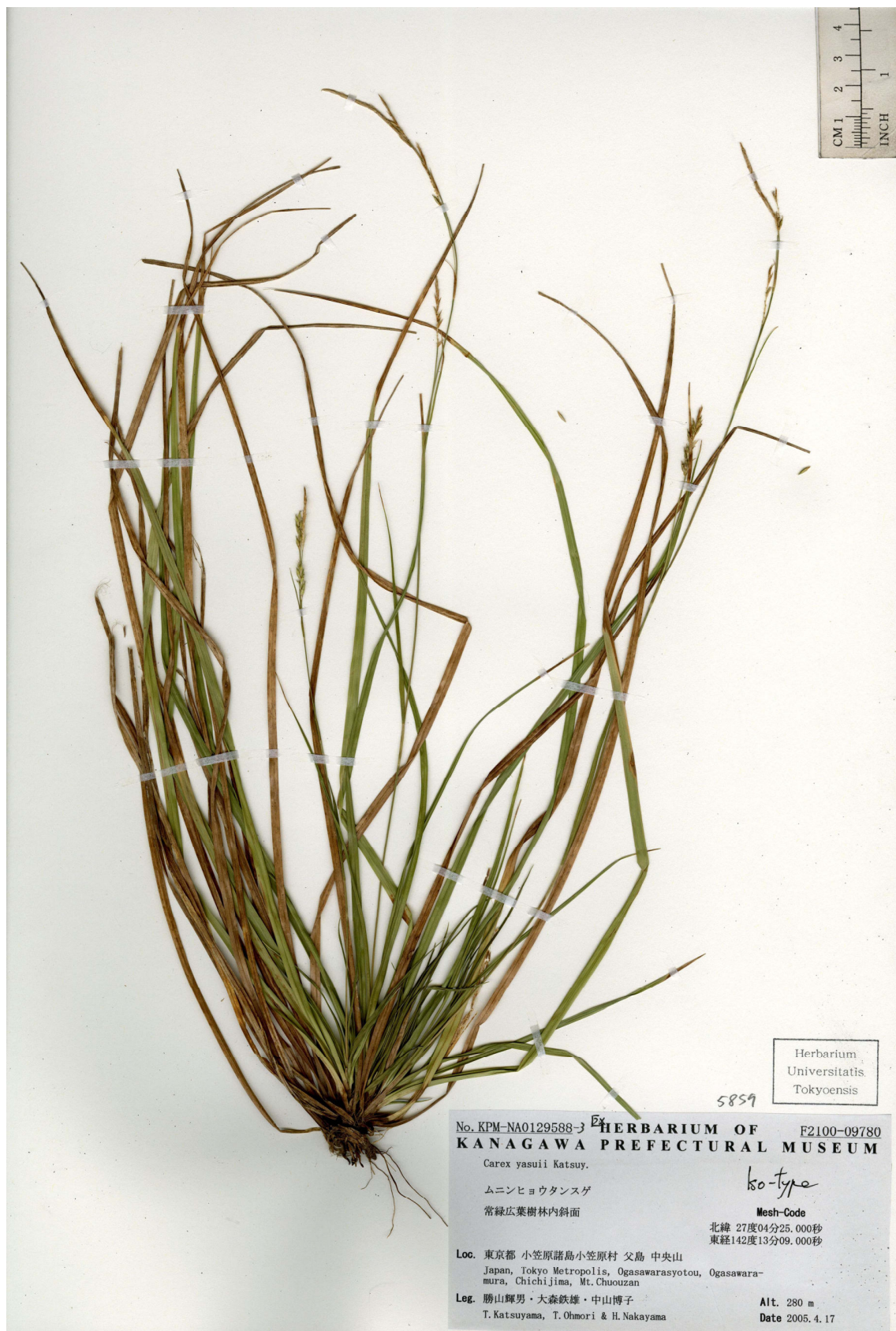
Fig. 6. Iso-type of Carex yasuii Katsuy. (T. Katsuyama et al. s.n., 17 Apr. 2005, TI).