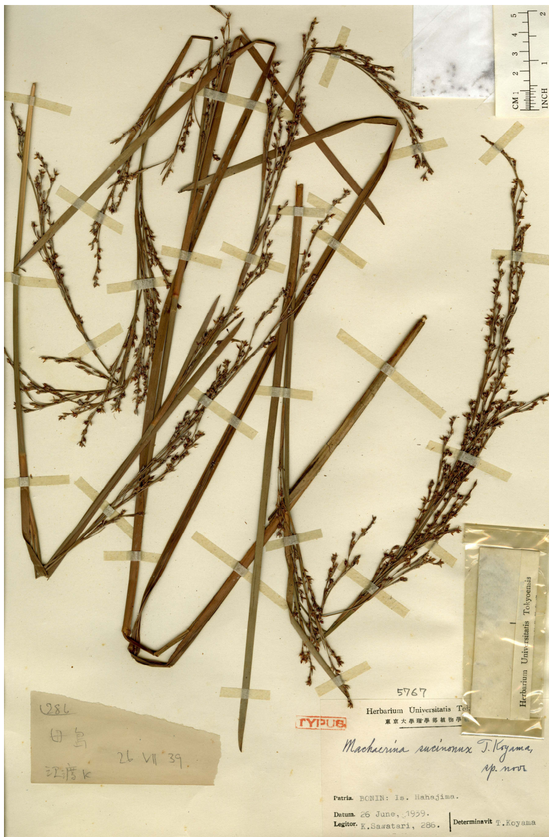
Fig. 10. Holotype of Machaerina sucinonux T. Koyama (K. Sawatari no. 286, 26 June 1934, TI).