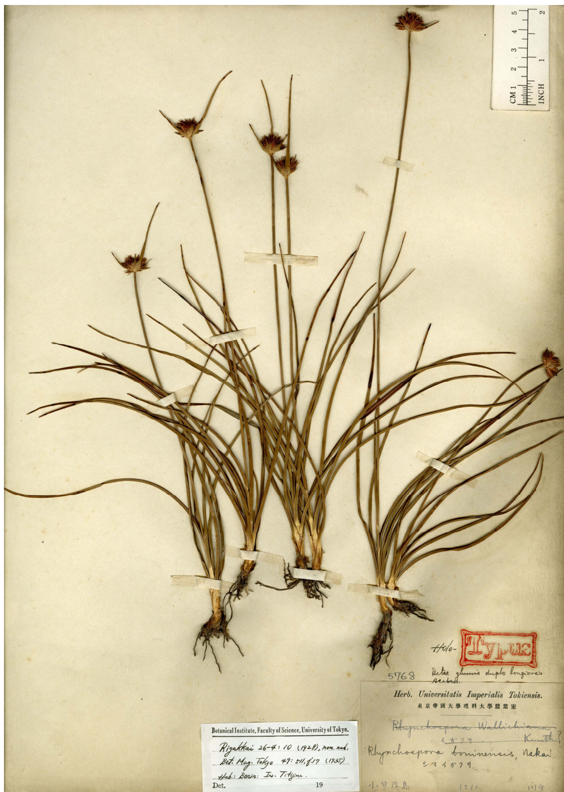
Fig. 11. Holotype of Rhynchospora boninensis Nakai ex Tuyama (H. Kawate s.n. in 1910, TI).