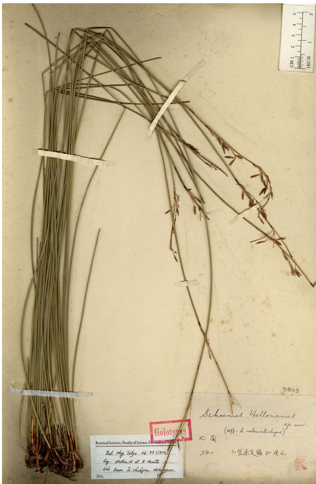
Fig. 13. Holotype of Schoenus Hattorianus Nakai (H. Hattori & K. Kawate s.n., TI).