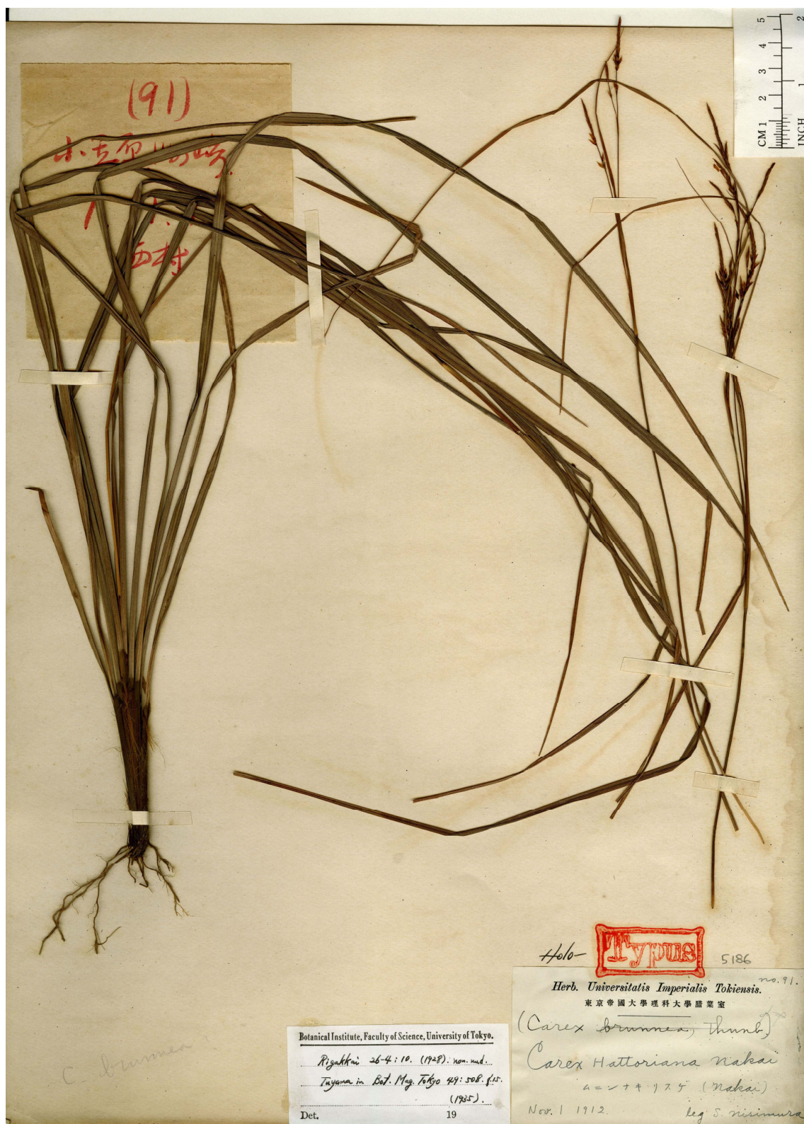
Fig. 4. Holotype of Carex hattoriana Nakai ex Tuyama (S. Nishimura no. 91, 1 Nov. 1912, TI).