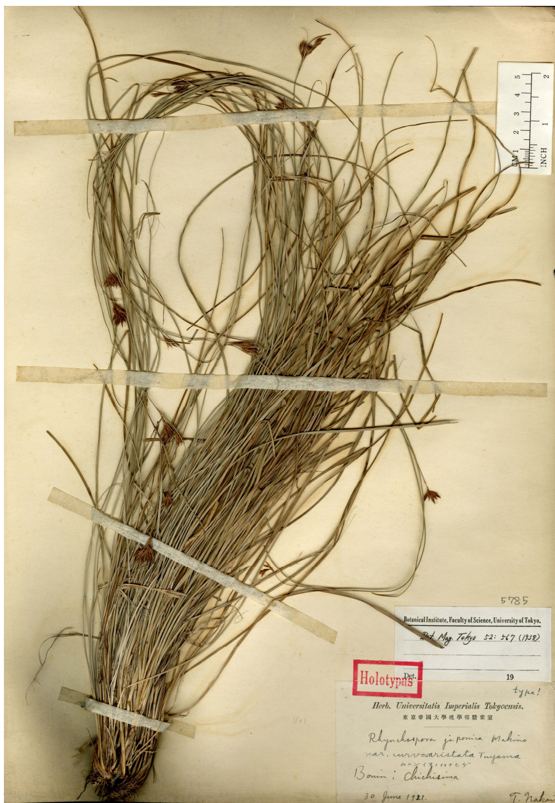
Fig. 12. Holotype of Rhynchospora japonica Makino var. curvo-aristata Tuyama (= R. chinensis Nees et Meyen ex Wight var. curvo-aristata (Tuyama) Ohwi) (T. Nakai s.n., 30 June 1921).