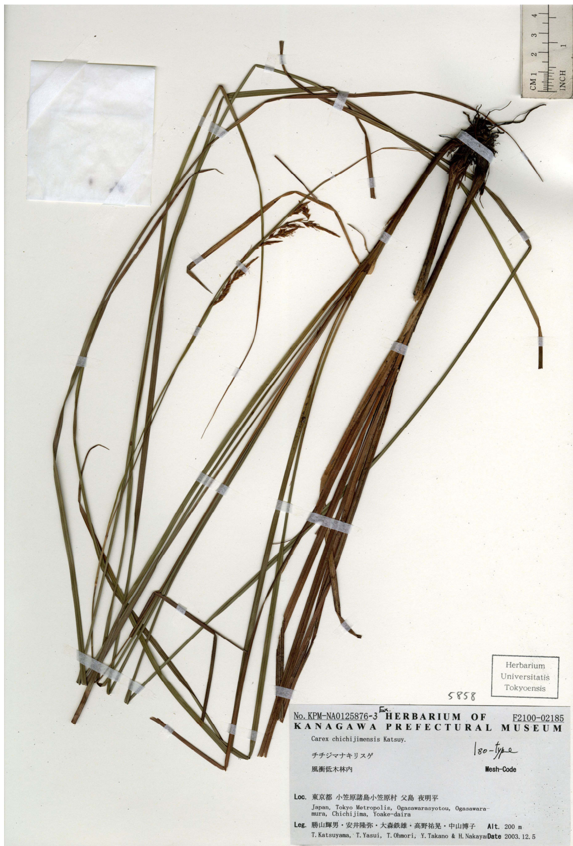
Fig. 3. Iso-type of Carex chichijimensis Katsuy. (T. Katsuyama et al. s.n., 5 Dec. 2003, TI).